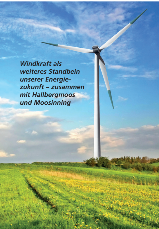
Windkraft als weiteres Standbein unserer Energiezukunft – zusammen mit Hallbergmoos und Moosinning

Bei einer Nutzung der Flächen mit einer großflächigen PV-Anlage können über 19.000 Haushalte mit Strom versorgt werden, was den Bedarf der Gemeinde weit übersteigt. Als nächster Schritt folgt die Überlegung, mit welchem Anlagentyp, wie z.B. Agri-Photovoltaik, die auch weiterhin eine landwirtschaftliche Nutzung der Flächen zulässt, gearbeitet werden soll.