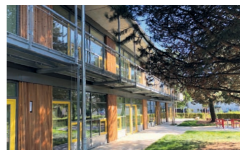
Erhalten werden konnte der Großteil des vorhandenen Baumbestandes