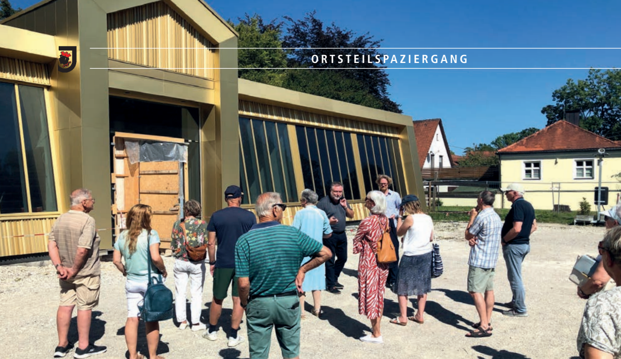
Beginn des Ortsteilspazierganges vor dem Kallmann-Museum